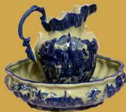
Αρ. ΕΕΤ: 222, Λαβωμάνο. Κεραμικό λαβωμάνο, ψημένο υαλομένο και ζωγραφισμένο με ανεπίπλο χρώμα. Η λέξη προέρχεται από το ιταλικό ρήμα lavare [ελληνική lava: πλένω] + mano [ελληνική manus: χέρι], το χρησιμοποιούσαν για το πλύσιμο των χεριών και του προσώπου. Το συνέναντε ιδίως στα νεοκλασικά σπίτια είτε την είσοδο είτε στην κρεβατοκάμαρα.

Η ιδιωτική συλλογή του Μητροπολίτη Ι. Μητρόπολης Μάνης κ. Χρυσόστομου αποτελείται από 18 ζωγραφικούς πίνακες καταξιωμένων καλλιτεχνών, 4 έργα χειροτεχνίας και 2 πάπυρους. Ανάμεσα στους ξεχωρίζουν τα έργα των Νικ. Μαγιάση, Χαρ. Παλαιολόγου, της Ειρ. Ξενοπούλου, της Λούπη Σηλυβρίδου – Πασαλάρη, Δήμ. Μηραέσα.